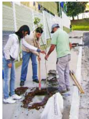
Equipe da Secretaria Municipal de Urbanismo e Meio Ambiente

O SEPREV promoveu, no início do mês de julho, o plantio de mudas de árvores nas áreas de sua sede, sendo cinco da espécie Ipê e uma da espécie Resedá. A proposta visa contribuir com a preservação do meio ambiente, e a ação contou com a colaboração da equipe da Secretaria Municipal de Urbanismo e Meio Ambiente, que foi responsável pelo plantio e pela doação das mudas. Vale lembrar que o SEPREV já realiza a coleta seletiva e pretende aumentar as ações de conscientização ambiental, adotando práticas que contribuam para o desenvolvimento sustentável.