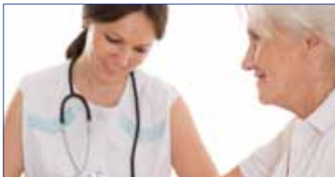
Página 6 - Medicina Preventiva