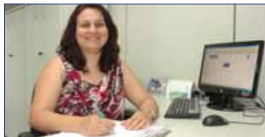
Página 3 - Assistente Social