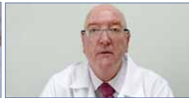
Página 7 - Quimioterapia agora em Indaiatuba