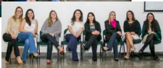
equipe multidisciplinar da medicina preventiva