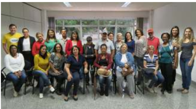
Em maio de 2017 o SEPREV realizou a maior concessão de aposentadorias de sua história

Ao se aposentar, o servidor se depara com uma nova realidade sem o compromisso com trabalho, iniciando-se, assim, um novo vínculo com o Instituto de Previdência que mantém o seu benefício. Com o acolhimento realizado no SEPREV, além de dar as boas-vindas aos novos beneficiários e deixá-los à vontade nesta nova etapa de suas vidas, o SEPREV pretende com o programa apoiá-los em sua jornada, ajudando-os a se conhecer melhor, a fim de fazer as suas escolhas e utilizar esta nova etapa da vida de forma produtiva, prazerosa e responsável.