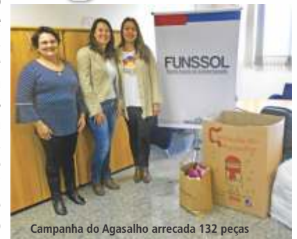
Campanha do Agasalho arrecada 132 peças

O SEPREV participou de mais uma edição da Campanha do Agasalho para arrecadação de roupas de inverno. A ação, realizada entre 1 e 23 de junho, contou com a colaboração dos funcionários da autarquia e arrecadou 132 itens, entre agasalhos, roupas e calçados. A entrega foi realizada no dia 27 de junho ao Funssol (Fundo Social de Solidariedade)